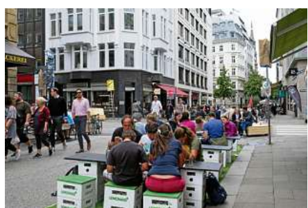
An der Kleinen Johannisstraße essen viele draußen.

Der Lieferverkehr kann von 23 bis 11 Uhr die Geschäfte dennoch anfahren. Die Umstellung des Autoverkehrs gilt